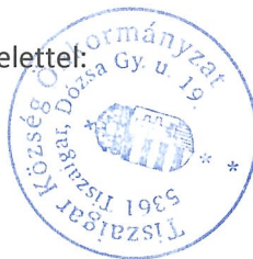
Szilágyi László polgármester